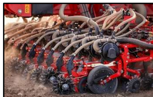
Proceed - Väderstad