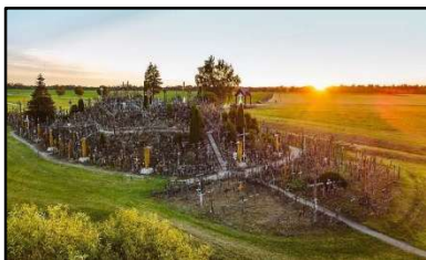
Berg der Kreuze

Die Abreise kann je nach Bedarf auch individuell ab Riga gestaltet werden. So gibt es von Riga unter anderem Direktflüge nach Hamburg, Frankfurt, München, Wien oder Budapest.