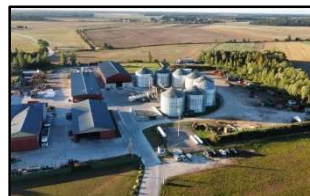
Betrieb UAB Klausis